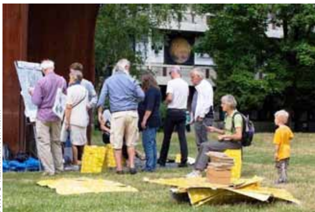
Die Freiflächen als „Aktionsraum“