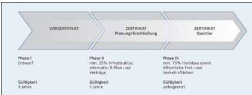
Verschiedenen Phasen der Zertifizierung bei einem Quartiersprojekt