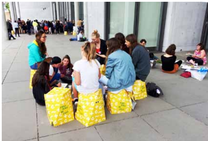
Die Freiflächen als „Schutz- und Warteraum“ vor der Pinakothek der Moderne