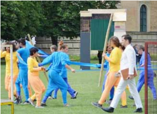
Tanz und Musik auf der Wiese vor der Alten Pinakothek