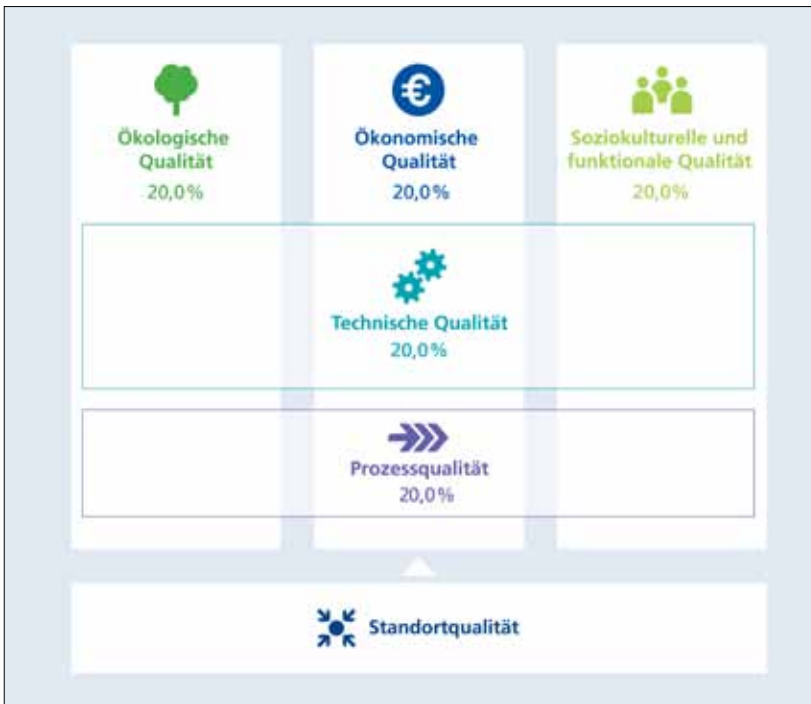
Der inhaltliche Aufbau des Zertifizierungsystems