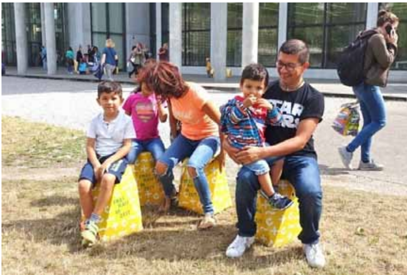
Die Freiflächen als „Spielraum“ für Eltern und Kinder