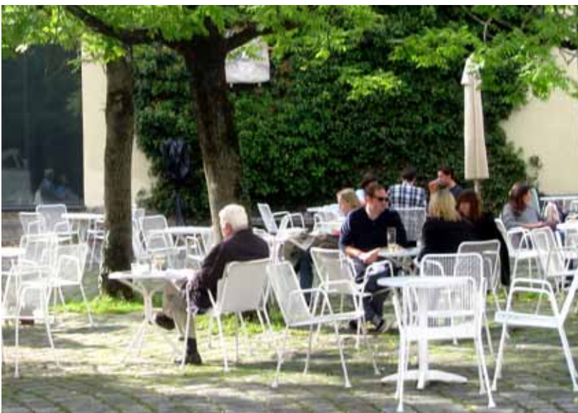
Die Freiflächen als „Ruheraum“, Das Café im Innenhof der Glyptothek am Königsplatz

doch die Schätze in den Häusern! „Das Grün habe ich zu Hause.“ Wenn man sich einmal niedersetzen möchte, hat jeder Besucher seinen Geheimtipp: Der eine schwärmt vom Café Klenze (zur Zeit im Umbau), dem anderen gefällt – uns schwer verständlich – das kühle Design des PdM-Cafés. Zwei Lieblingsorte im Freien werden immer wieder genannt: das Café im Innenhof der Glyptothek und die Aussicht vom Vorhölzer-Zentrum – ein Highlight zum Sehen, Sitzen und Verweilen, und dies ohne Konsumzwang. An Letzterem sehen viele besonderen Bedarf.