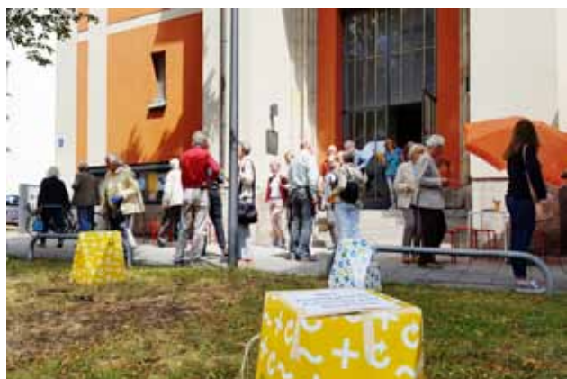
FreiRaum-Aktion am „Entree zum Kunstareal“ vor der St.-Markus-Kirche